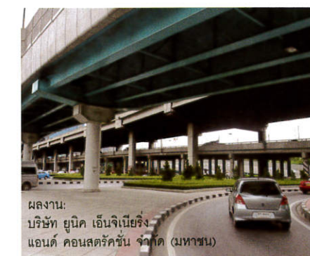
ผลงาน: บริษัท ยูนิค เอ็นจิเนียริง แอนด์ คอนสตรัคชั่น จำกัด (มหาชน)

โดยโครงการที่ได้ลงนามร่วมกับบริษัทในกลุ่มบริษัท กัลฟ์ เจพี จำกัด นั้นเป็นโครงการก่อสร้างท่อก๊าซธรรมชาติ เพื่อเชื่อมต่อระหว่าง