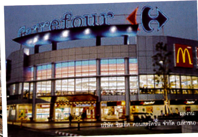
ผลงาน: บริษัท ซินเท็ค คอนสตรัคชั่น จำกัด (มหาชน)