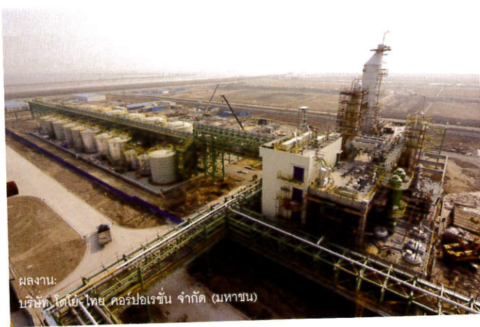
ผลงาน: บริษัท โตโย-ไทย คอร์ปอเรชั่น จำกัด (มหาชน)