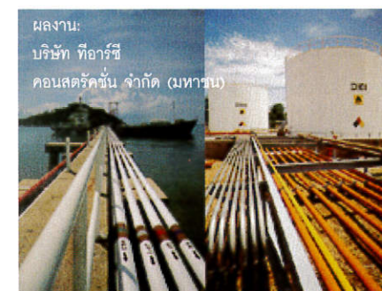
ผลงาน: บริษัท ทีอาร์ซี คอนสตรัคชั่น จำกัด (มหาชน)

893 ล้านบาท ซึ่งจะทยอยรับรู้ต่อเนื่องไปจนกระทั่งถึงปี 2554 และหากรวมโครงการในกลุ่มบริษัท กัลฟ์ เจพี จำกัด และที่ยังไม่ได้เซ็นสัญญา แต่ได้รับ Letter of Intent แล้ว บริษัทฯ และบริษัทย่อยจะมีงานในมือถึง 3,616 ล้านบาท ซึ่งจะทยอยรับรู้รายได้ต่อเนื่องไปจนกระทั่งปี 2556 และขณะนี้มีการยื่นประมูลงานใหม่เพิ่มเติมอย่างต่อเนื่อง โดยช่วงที่เหลือของปีนี้คาดว่าจะเข้าประมูลงานใหม่อีกมูลค่าประมาณ 2,000-3,000 ล้านบาท