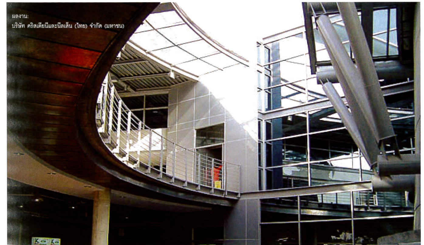
ผลงาน: บริษัท คริสเตียนีและนิลเสน (ไทย) จำกัด (มหาชน)

CNT ได้คาดว่าจะทำรายได้ปี 2553 อยู่ที่ 465 ล้านบาท จากความสามารถในการเพิ่มระดับมาร์จิ้น และปริมาณงานประมูลที่เพิ่มขึ้น คาดว่าจะมี Backlog สูงถึง 6,000 ล้านบาทในปี 2553 CNT สามารถเพิ่มมาร์จิ้นได้เหนือกว่าบริษัทคู่แข่งจากนโยบาย CPB Business Integration หนุนกำไรโต เพราะใช้บริการสินค้า และการเงินที่ต่ำกว่าคู่แข่งจากบริษัทในเครือสำนักทรัพย์สิน อาติดอกเบี่ยพิเศษจาก SCB และ วัสดุก่อสร้างจาก SCC Group