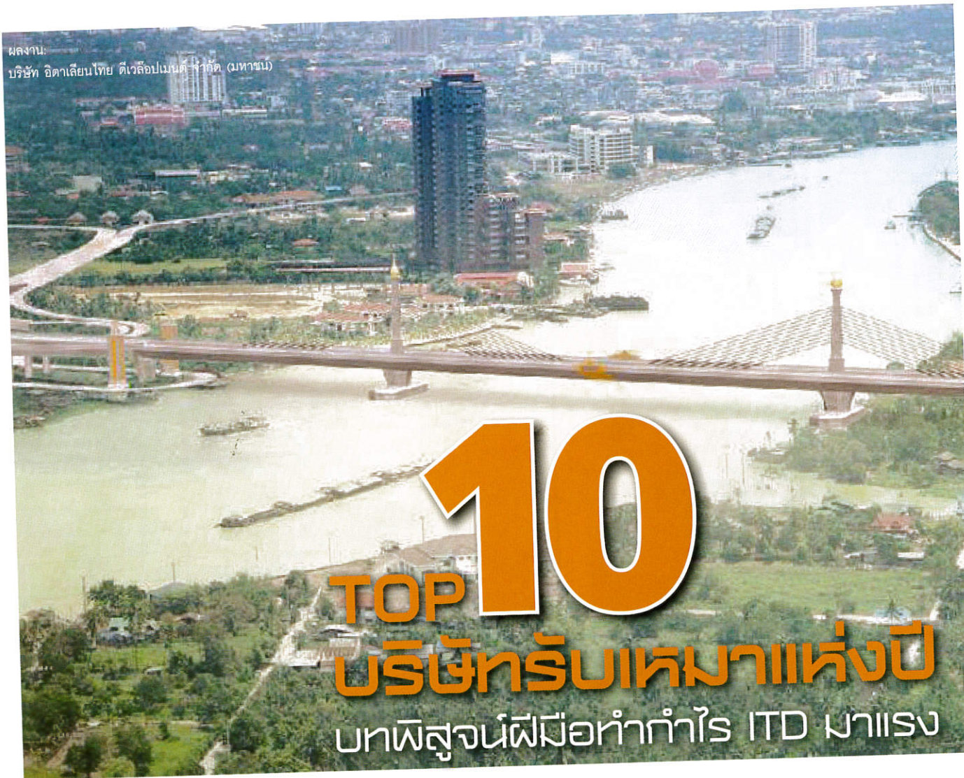
ผลงาน: บริษัท อิตาเลียนไทย ดีเวลล็อปเมนต์ จำกัด (มหาชน)