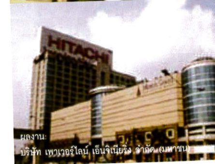
ผลงาน: บริษัท เพาเวอร์ไลน์ เอ็นจิเนียริง จำกัด (มหาชน)