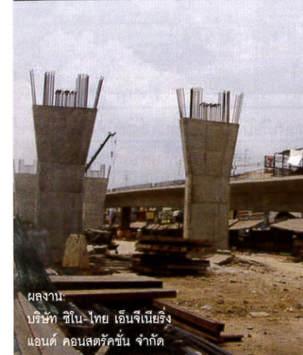
ผลงาน: บริษัท ชิโน-ไทย เอ็นจีเนียริ่ง แอนด์ คอนสตรัคชั่น จำกัด