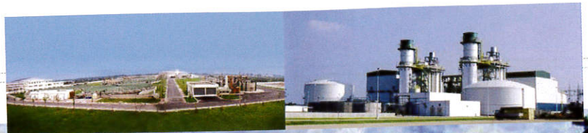
ผลงาน: บริษัท เนาวรัตน์พัฒนาการ จำกัด (มหาชน)

SEAFCO มีแนวโน้มผลประกอบการ ไตรมาส 3/2553 มีโอกาสพลิกเป็นกำไร เนื่องจาก ไตรมาสดังกล่าวสามารถรับรู้รายได้อย่างน้อย 1.3 พันล้านบาท เพราะมีงานในมือที่รอรับรู้ รายได้ (Backlog) มูลค่าประมาณ 1.7 พันล้าน บาท คาดว่าจะรับรู้ในปีนี้ 1 พันล้านบาท และ โครงการรถไฟฟ้าสายสีม่วงที่รับช่วงต่อจาก บริษัท